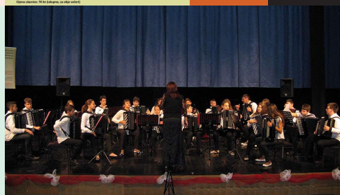
Orkestar harmonika iz Poreča

Natjecateljski dio bio je već uobičajeno održan drugoga dana Festivala. U Kazališno-koncertnoj dvorani Ivana Brlić-Mažuranić 22. studenoga 2014. pred tročlanim međunarodnim stručnim ocjenjivačkim sudom u sastavu Goran Penić (Novi Sad, Republika Srbija), Senad Kazić (Sarajevo, Bosna i Hercegovina) i Sanja Nuhanović (Slavonski Brod, Republika Hrvatska) predstavila su se četiri orkestra. Pobjednik 5. međunarodnoga festivala harmonike Bela pl. Panthy bio je Orkestar harmonika iz Poreča. 5. međunarodni Festival bit će zapamćen i po tome što je imao čast ugostiti predsjednika Republike Hrvatske dr. sc. Ivu Josipovića.